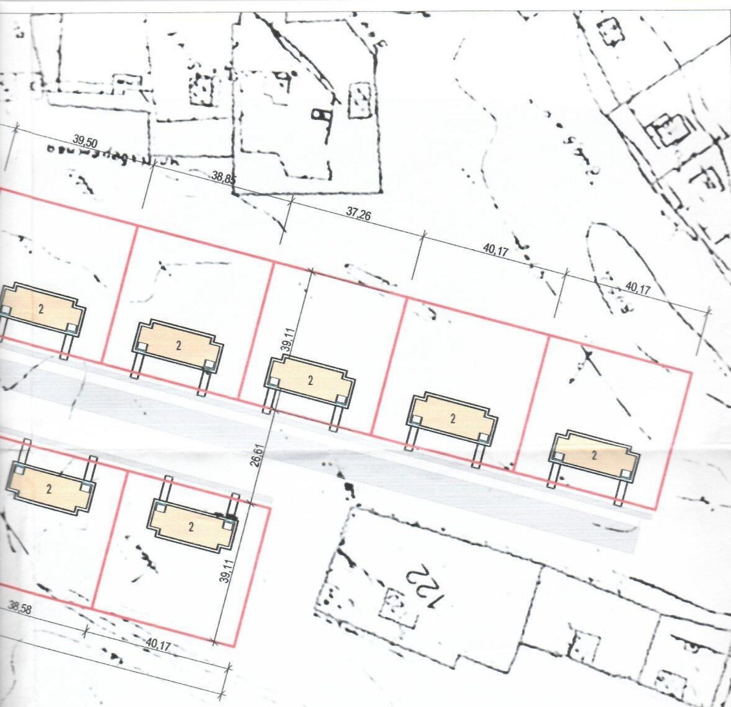
Ведомость жилых и общественных зданий и сооружений